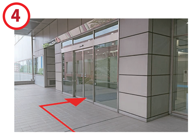
こちらの入口に入って、左手になります

※駐車場をご利用の方へ、エレベーターを利用される際は東1駐車場4階で降りてください