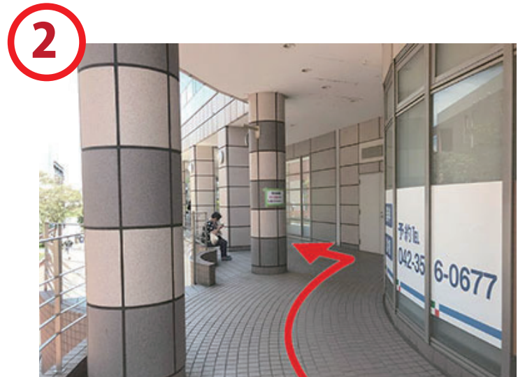
こちらの通路を建物に沿って進みます