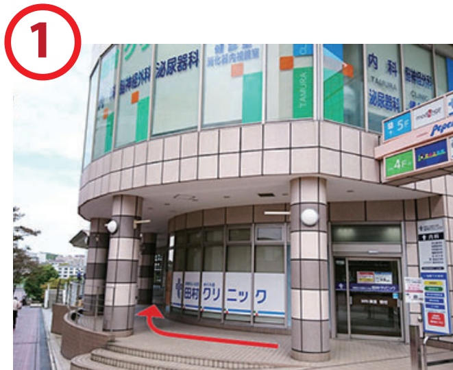
田村クリニックの左奥横の通路を進みます