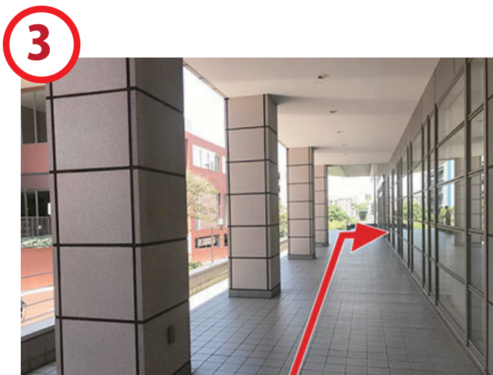
突き当り、右が入口です